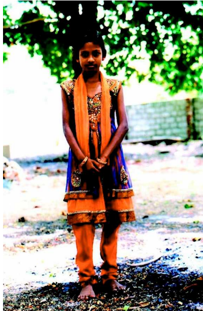
CPSP 301. Agalya

Na žádost rodičů byla v roce 2014 zřízena nástěnka s touto tematikou.